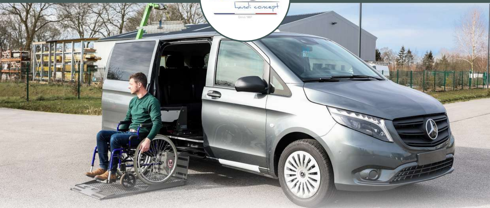
PLATE-FORME MONO-POUTRE PLATE-FORME ÉLÉVATRICE MONO BRAS

La plate-forme élévatrice Mono poutre a été conçue pour l'accès au véhicule en fauteuil roulant. Installée à l'arrière ou en porte latérale du véhicule, ses petites dimensions et son poids permettent de l'installer sur un grand nombre de modèle de véhicules. Les opérations de descente et montée ainsi que le déploiement sont automatiques et contrôlés par une télécommande, tandis que la rotation se fait manuellement.