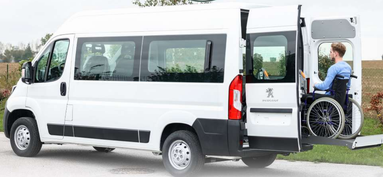
PLATE-FORME DOUBLE BRAS

Les plate-formes élévatrices à double bras ont été conçues pour l'accès au véhicule en fauteuil roulant. Installées à l'arrière du véhicule, ses différentes dimensions et son poids permettent de l'installer sur un grand nombre de modèle de véhicules. Les opérations de descente et montée ainsi que le déploiement sont automatiques et contrôlés par une télécommande. Une fois pliée, la plate-forme laisse une bonne visibilité à l'arrière.