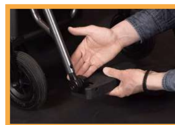
Repose-pieds réglables en hauteur