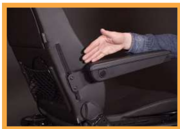
Inclinaison et hauteur des accoudoirs réglables