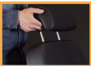
Appui-tête réglable en hauteur